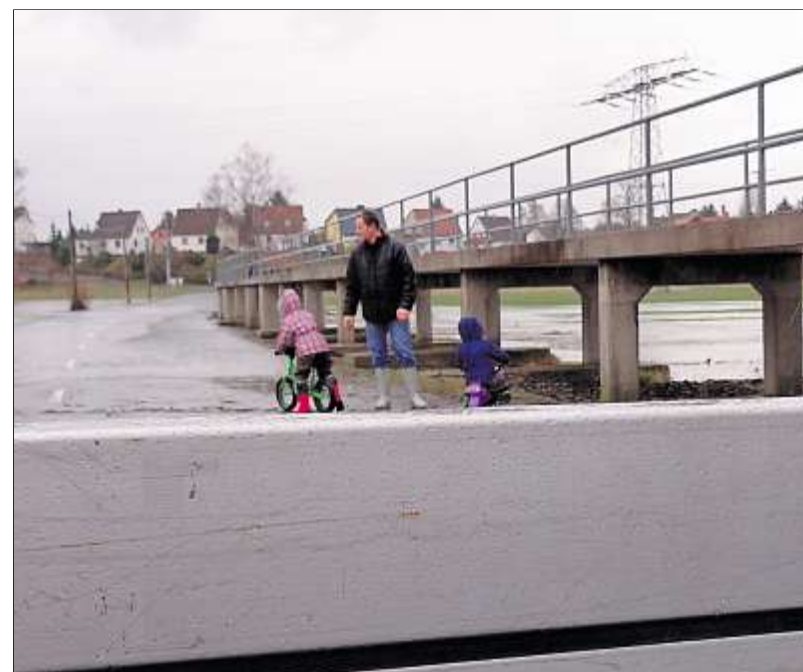
Für die Linder Kinder ist das Hochwasser immer ein Erlebnis.