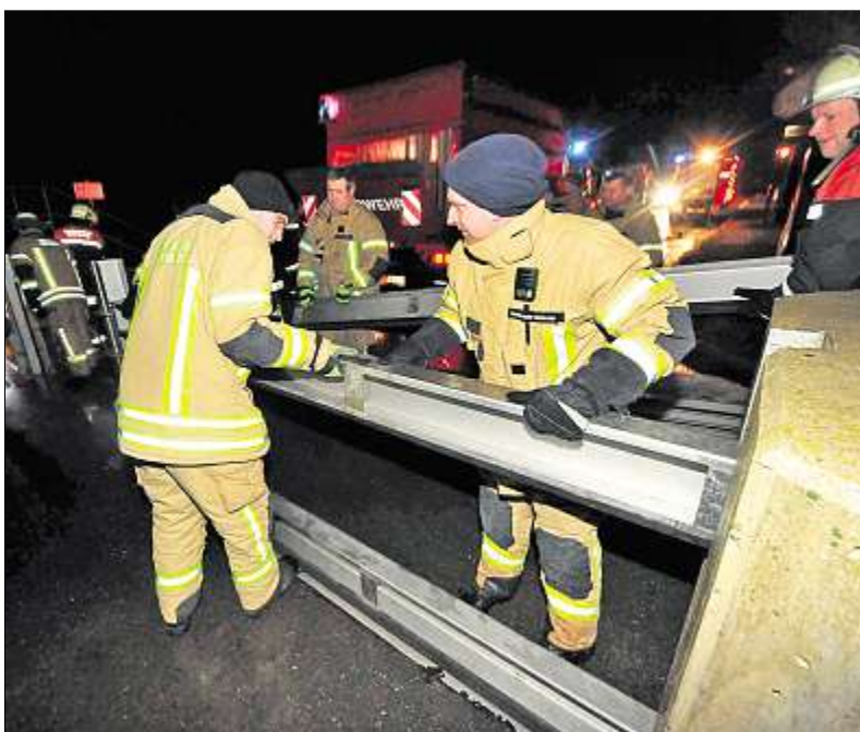
Schutzplankeneinbau an der Flutmulde.