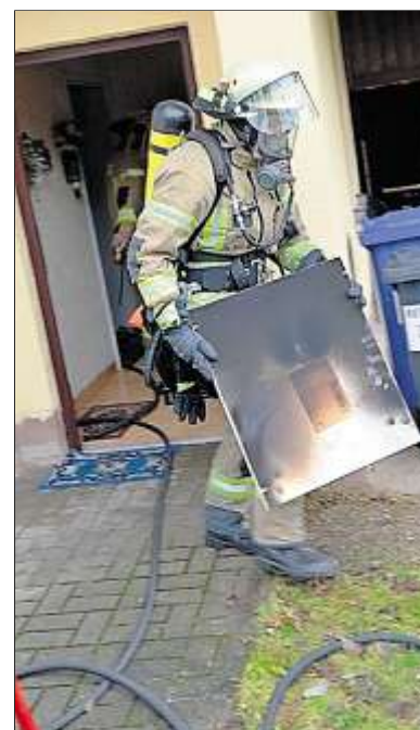
Alarm in einer Küche auf der Wehd.