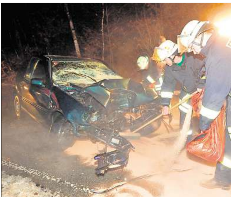
Ein 18-jähriger fuhr zwischen Förritz und Rottmar gegen einen Baum.

Glimpflich für die Bewohner, nicht aber für die Küche, ging ein Küchenbrand in Sonneberg aus. Bei dem Brand entstand am Montag ein Sachschaden von geschätzten 10000